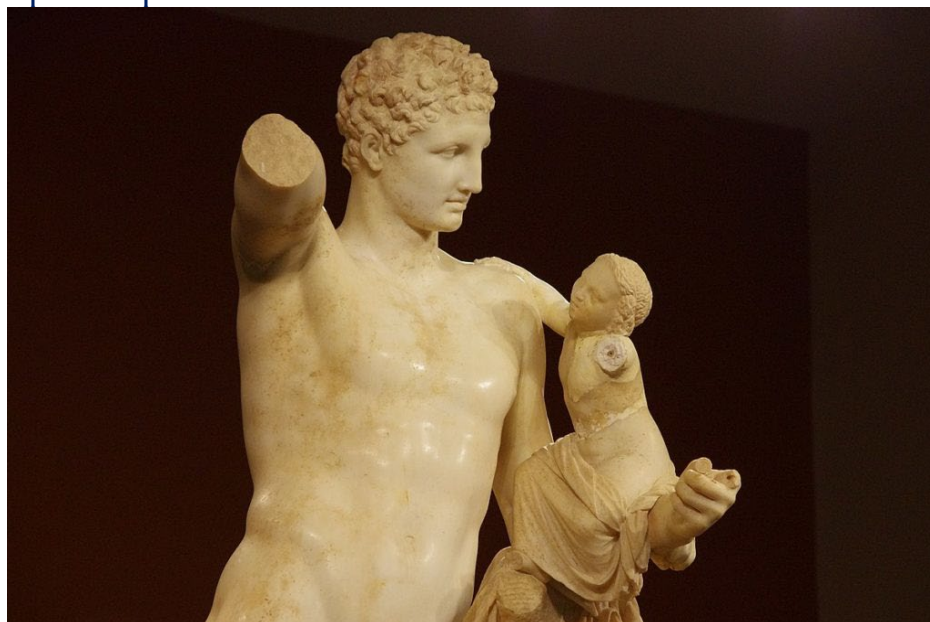
Древнегреческая статуя Гермеса работы Праксителя.

В первые же часы своей жизни он каким-то образом выбрался из колыбели, прошёл через всю деревню и украл несколько быков Аполлона. В произведениях Гомера, «Илиаде» и «Одиссее», хотя эта традиция и не упоминается, Гермес предстаёт хитрым воров.